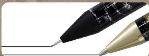
0.5mm ゲルインクペン&シャープペンシル