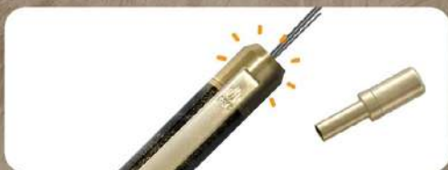
プッシュボタンを取り外せば、替芯を補充できます