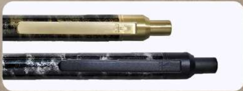
低鉛真鍮とメタルカラーの配色