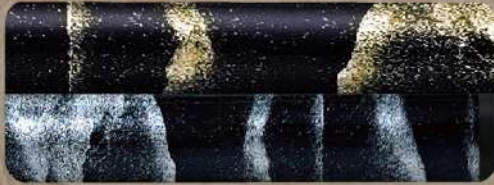
流れるような漆塗りの技法