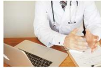
医師と患者の共用メモ